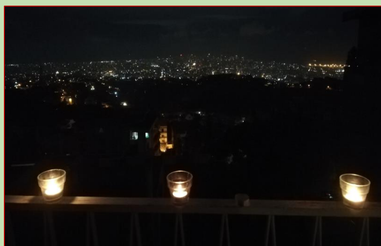
De Armeense genocide werd dit jaar thuis herdacht met het plaatsen van kaarsjes op het balkon

Terugkijkend springen de ontmoetingen met de betrokken gemeenten in Nederland eruit als momenten van bijzondere verbondenheid. We denken in de eerste plaats aan de Lichtkring, onze zendende gemeente. Er waren wederzijdse bezoeken, trouwe kaartjes, mailtjes, en tastbare ondersteuning voor projecten waarbij wij betrokken waren.