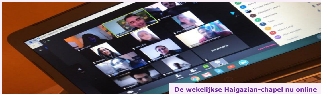
De wekelijkse Haigazian-chapel nu online

De komende tijd zal daarom ongetwijfeld in het teken staan van groeiende armoede. Terwijl het diaconaat in de afgelopen jaren veel Syrische vluchtelingen heeft bijgestaan, zullen de kerken nu de handen vol hebben om de eigen gemeenschap te ondersteunen.