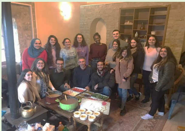
Haigazian studentenretraite over 'gender en seksualiteit in het licht van de Bijbel', net voor de lockdown begon.